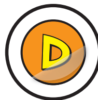
Kein Farbabrieb, da mit Polycarbonat-Schutzlaminat ausgerüstet