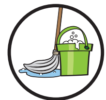
Keine besondere Pflege erforderlich