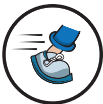
Rutschfest nach DIN 51130 Klasse R9

Unsere Bodenkleber lassen sich mit allen handelsüblichen Reinigern reinigen. Die Nutzung von Reinigungsmaschinen sollten die Aufkleber bei einer vorschriftsmäßigen Aufbringung und dem vollständigen Anziehen problemlos aushalten.