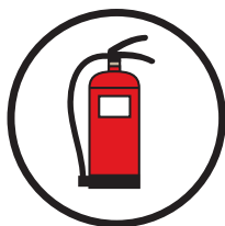
Schwer entflammbar nach DIN EN 15501-1