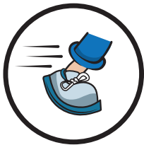
Rutschfest nach DIN 51130 Klasse R9