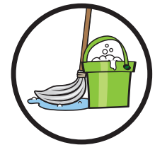
Keine besondere Pflege erforderlich