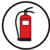
Schwer entflammbar nach DIN EN 15501-1